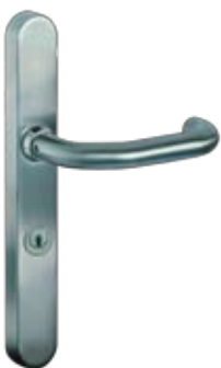
Kaba TouchGo™ Türbeschlag

Das oberste Ziel jedes Schließsystems ist Sicherheit. Diese ist bei Kaba TouchGo™ in höchstem Maß gegeben, denn ein verloren gegangenes Zutrittsmedium wird rasch und einfach gesperrt. So werden gleichzeitig Sicherheitslücken und auch das kostenintensive Ersetzen ganzer Schließanlagen vermieden. Neben dem neuen Komfort ist dies ein weiterer wesentlicher Vorteil des elektronischen Zutrittssystems.