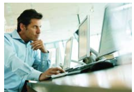
Maximaler Investitionsschutz dank einfach programmierbarer Berechtigungsmedien.

Auch hier bleiben keine Wünsche offen, denn der Kaba c-lever mit Kaba TouchGo™ Funktion wird nahtlos in die bestehenden Kaba Sicherheitskonzepte eingebunden. Ihr System bleibt so sicher, wie es bereits war: Kaba TouchGo™ ist eine Komfortoption, die keinen Einfluss auf Ihr Sicherheitsdispositiv hat und höchsten Investitionsschutz garantiert.