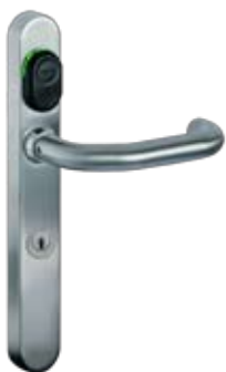
Kaba c-lever mit TouchGo™-Funktion

Der Kaba c-lever mit Kaba TouchGo™ Funktion verfügt über ein optionales Elektronikmodul, welches die Kaba TouchGo™ Eigenschaften in den Beschlag integriert. Um die Vorteile des schlüssellosen Eintritts nutzen zu können, braucht es nur noch einen aktiven Kaba TouchGo™ Kartenhalter. Somit behalten Sie Ihre RFID-Funktionen und profitieren gleichzeitig vom Kaba TouchGo™ Bedienkomfort.