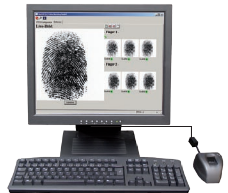
Das sorgfältige Erfassen des Fingerabdrucks, der als Referenzabdruck gespeichert wird, sichert eine einwandfreie und schnelle Funktion der biometrischen Lösung.