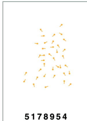
Die Minutien werden über einen Algorithmus in eine Zahlenkolonne umgewandelt. Es werden keine Bilder der Fingerabdrücke, sondern reine Zahlenkolonnen abgespeichert.