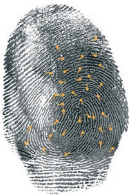
Digitales Bild eines Fingerabdrucks mit den vom System erkannten und verwendeten Minutien.